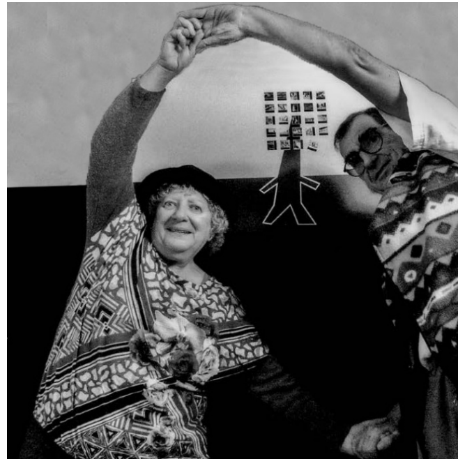
SERÉ JO...? – 1st CONTEMPORARY WINTER – VENEZIA (1914)